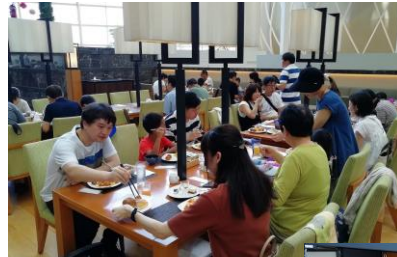
高級ホテルでのビュッフェランチ