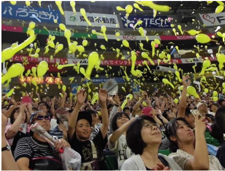
ホークスで埋め尽くされたヤフオクドーム

①プロ野球観戦(福岡ソフトバンクホークス対北海道日本ハム)、②水族館鑑賞の二手に分かれ、思い思いの休日を過ごしました。