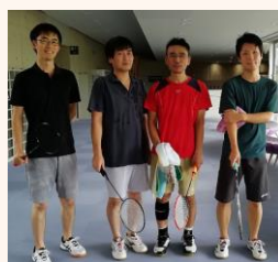
見事3位入賞した農水チーム