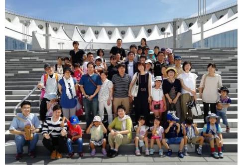
水族館鑑賞の参加者

恒例行事となっている福岡日帰りバスツアーを8月10日(土)に実施し、“ヤフオクドームプロ野球観戦”コースに45名、“マリンワールド海の中道水族館鑑賞”コースに51名、合計96名の参加がありました。今年はお盆時期の開催ということで、交通渋滞が心配されましたが、概ね予定通りに進み、一行はヒルトンホテルで高級ランチビュッフェを堪能したあと、