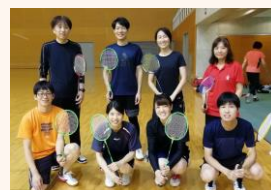
伸び伸びとプレーした健福チーム